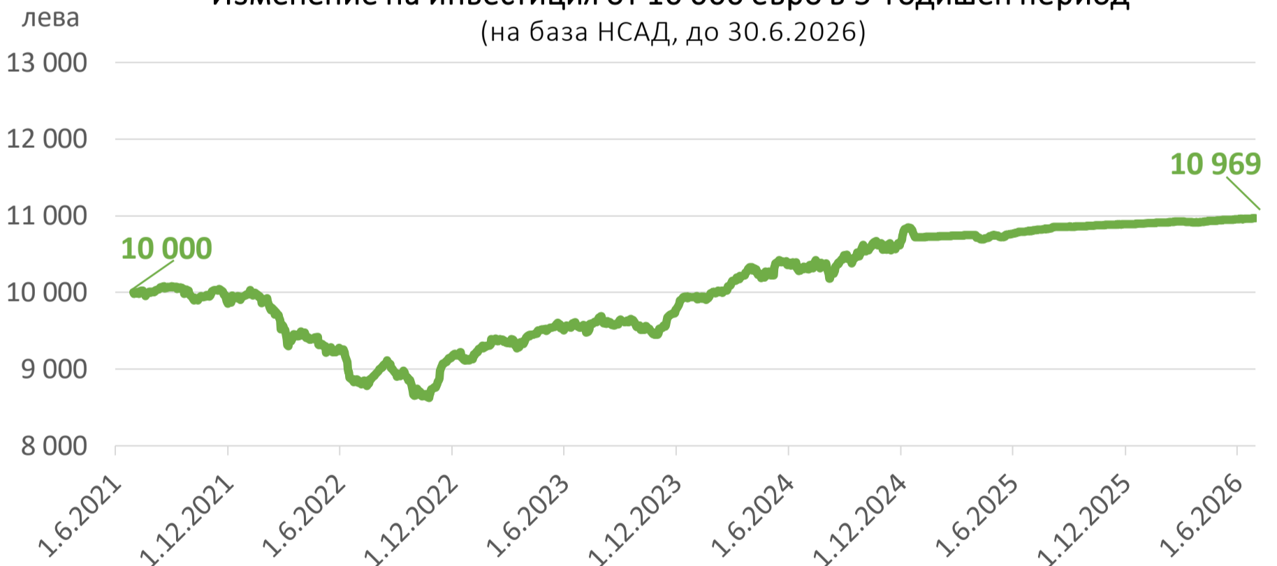
Изменение на инвестиция от 10 000 евро в 5-годишен период (на база НСАД, до 30.6.2026)