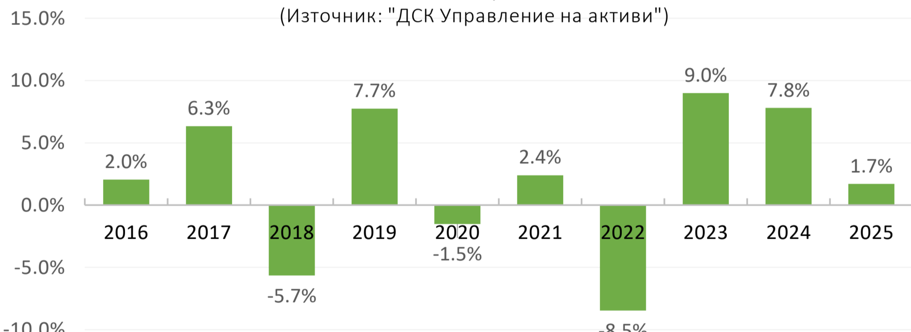
Годишна доходност за периода 2016 г. - 2025 г.

* До 21.01.2025 г. Фондът следва различна инвестиционна стратегия и резултатите му са постигнати при условия, които след тази дата вече не са приложими (предишно име „ДСК Стабилност - Немски акции“)