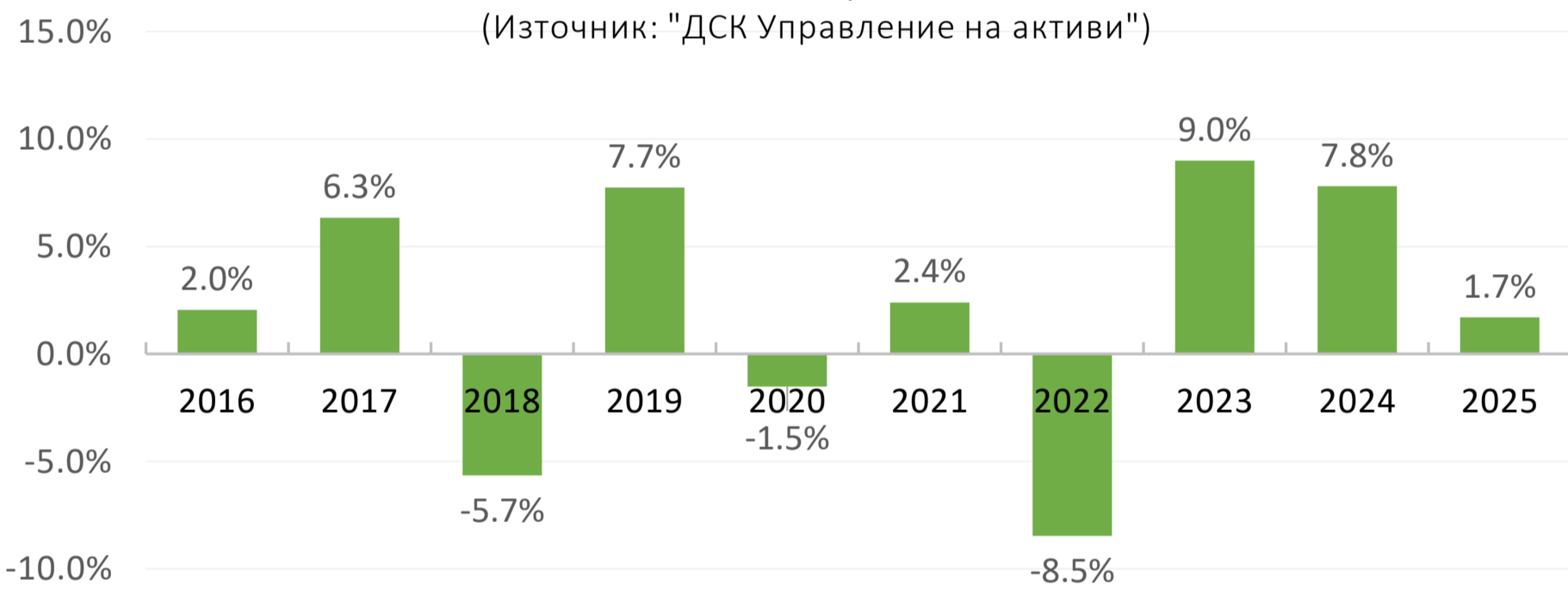
Годишна доходност за периода 2016 г. - 2025 г.

* До 21.01.2025 г. Фондът следва различна инвестиционна стратегия и резултатите му са постигнати при условия, които след тази дата вече не са приложими (предишно име „ДСК Стабилност - Немски акции“)