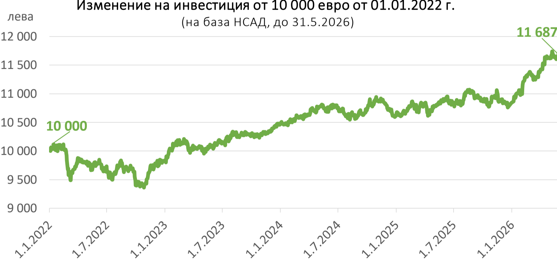
Изменение на инвестиция от 10 000 евро от 01.01.2022 г. (на база НСАД, до 31.5.2026)