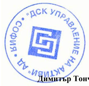
Димитър Тончев Прокурист на УД „ДСК Управление на активи” АД организиращо и управляващо Договорен фонд „ДСК Растеж”