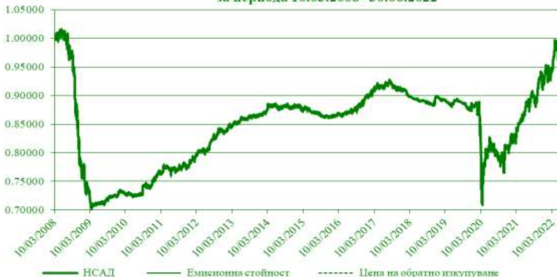
НСАД, емисионна стойност и цена на обратно изкупуване за периода 10.03.2008 – 30.06.2022