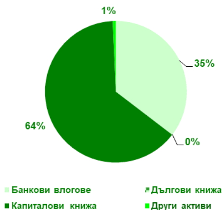
Структура на активите на ДСК Глобални защитни компании към 31.12.2019 г.