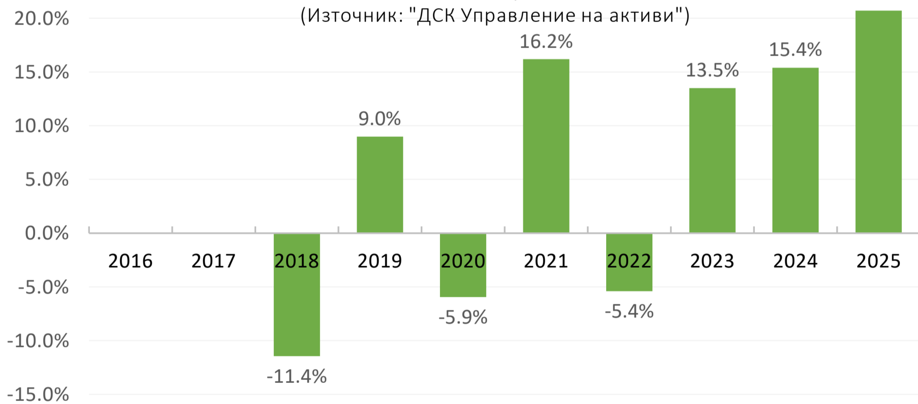
Изменение на инвестиция от 10 000 евро в 5-годишен период