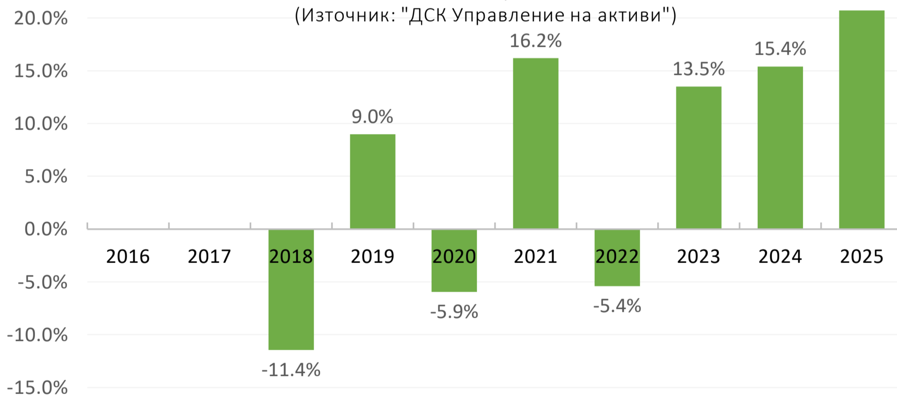
Изменение на инвестиция от 10 000 евро в 5-годишен период