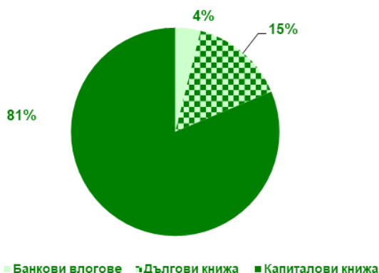
Структура на активите на ДСК Глобални Компании към 31.12.2023 г.