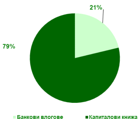
Структура на активите на ДСК Глобални Компани към 31.12.2021 г.