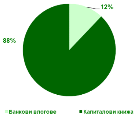
Структура на активите на ДСК Глобални Компани към 31.12.2020 г.