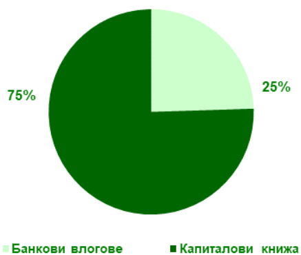
Структура на активите на ДСК Глобални Компани към 31.12.2019 г.