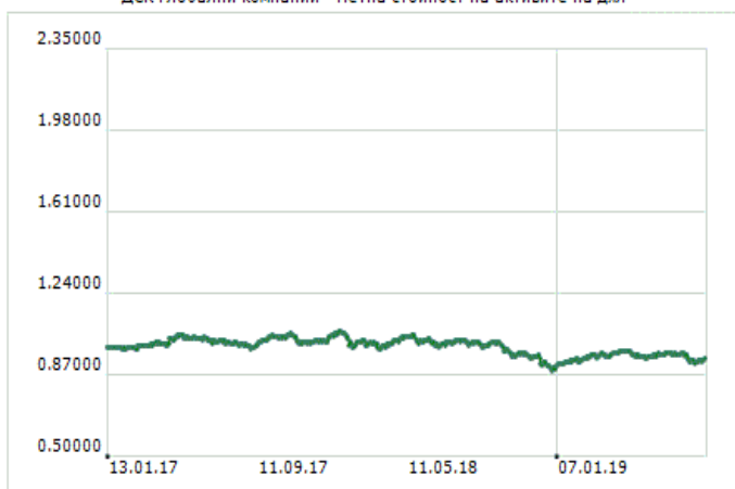
ДСК Глобални компании - Нетна стойност на активите на дял