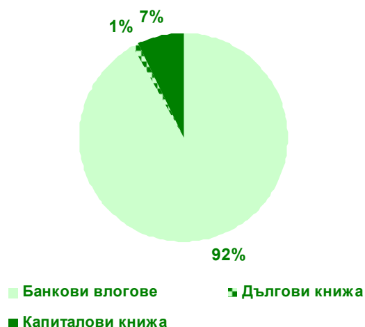
Структура на активите на ДСК Евро Актив към 31.12.2009 г.