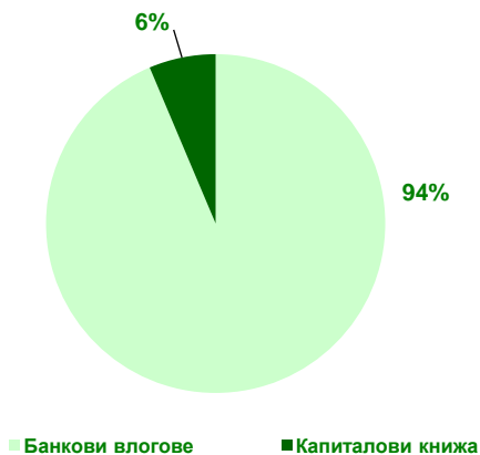
Структура на активите на ДСК Хоризонт 2040 към 31.12.2021 г.