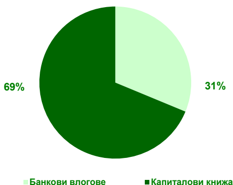
Структура на активите на ДСК Хоризонт 2035 към 31.12.2022 г.