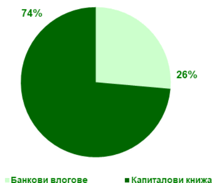
Структура на активите на ДСК Хоризонт 2035 към 31.12.2022 г.