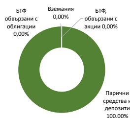
ОБЩО АКТИВИ РАЗПРЕДЕЛЕНИ ПО КЛАСОВЕ

Подробна информация относно дяловете от фондовете, дистрибутирани от Банка ДСК, може да получите от поделенията на Банката, предлагащи фондове, както и от интернет страниците на Банка ДСК (www.dskbank.bg) и на ДСК Управление на активи АД (www.dskam.bg). Информацията е достъпна на български език. Инвеститорите трябва да имат предвид, че стойността на дяловете на фонд и доходът от тях могат да се понижат, печалба не е гарантирана и те поемат риска да не възстановят инвестицията си в пълен размер. Инвестициите в дялове на фонд не са гарантирани от гаранционен фонд, създаден от държавата, или с друг вид гаранция. Бъдещите резултати от дейността на фонда не са задължително свързани с резултатите от предходни периоди. Данните в Бюлетина са на база стойности, публично обявени за последния работен ден на месеца.