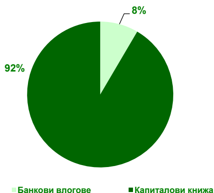
Структура на активите на ДСК Хоризонт 2030 към 31.12.2022 г.