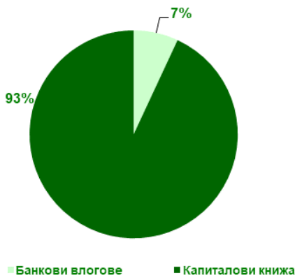
Структура на активите на ДСК Хоризонт 2030 към 31.12.2022 г.