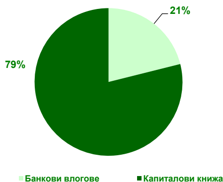
Структура на активите на ДСК Хоризонт 2030 към 31.12.2021 г.