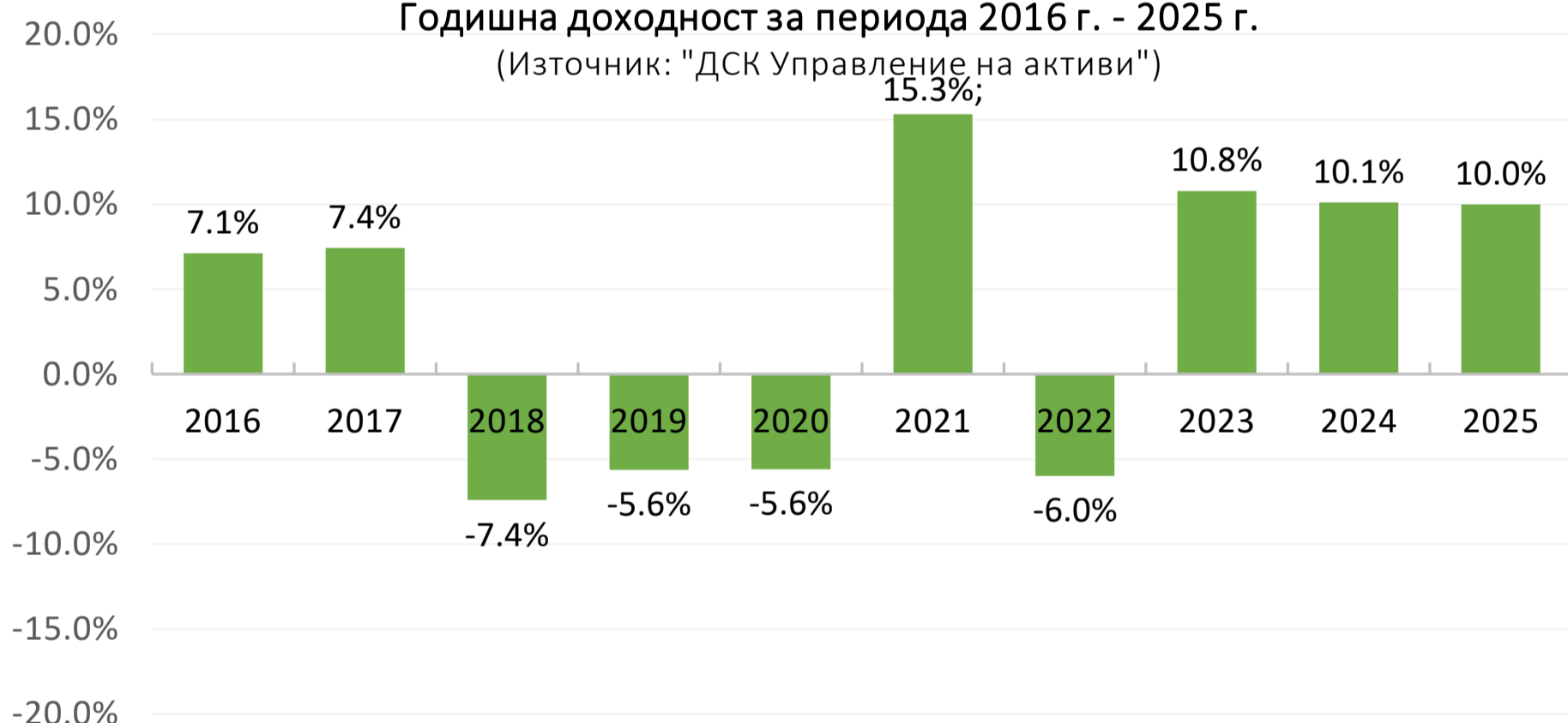
Изменение на инвестиция от 10 000 евро в 5-годишен период