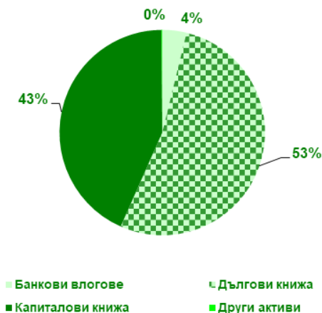
Структура на активите на ДСК Баланс към 31.12.2023 г.