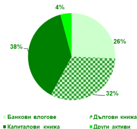
Структура на активите на ДСК Баланс към 31.12.2019 г.