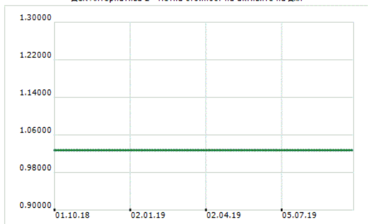
ДСК Алтернатива 2 - Нетна стойност на активите на дял