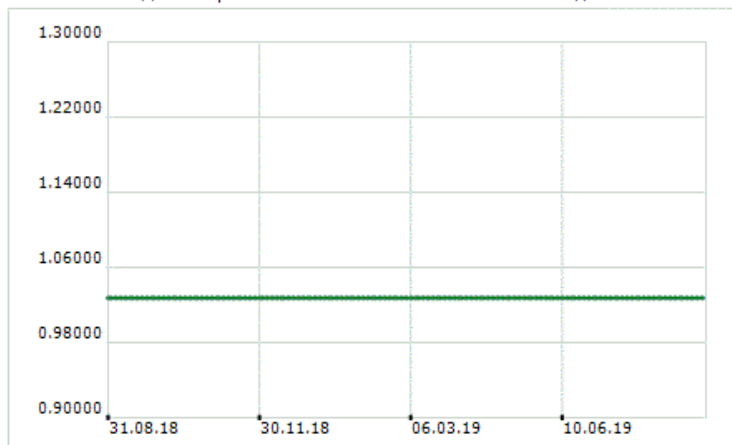
ДСК Алтернатива 2 - Нетна стойност на активите на дял