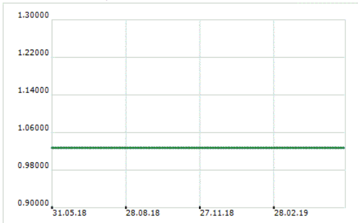
ДСК Алтернатива 2 - Нетна стойност на активите на дял