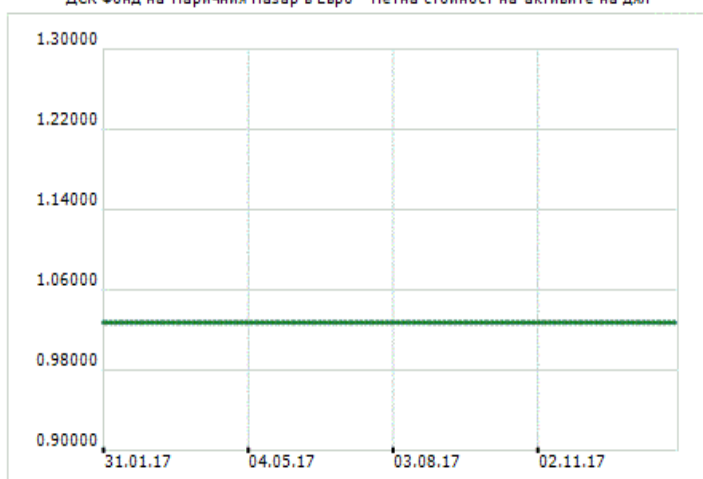
ДСК Фонд на Паричния Пазар в Евро - Нетна стойност на активите на дял