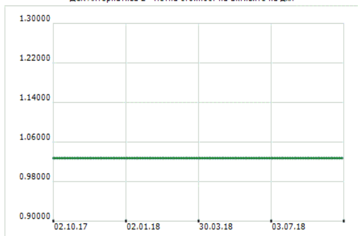
ДСК Алтернатива 2 - Нетна стойност на активите на дял