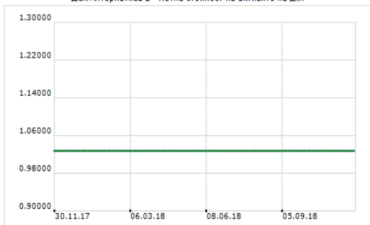
ДСК Алтернатива 2 - Нетна стойност на активите на дял