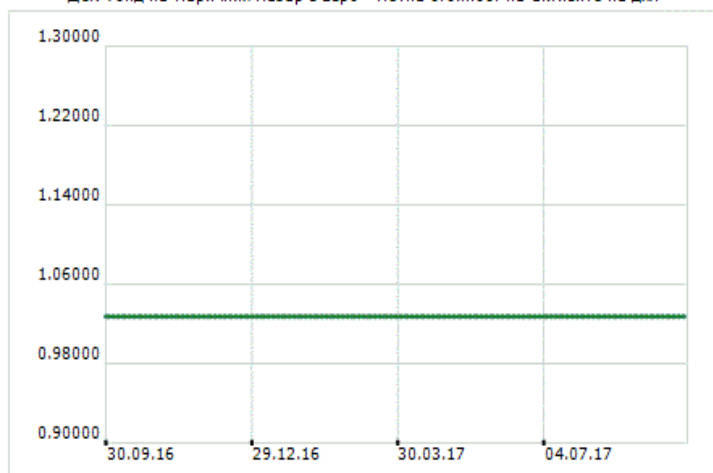
ДСК Фонд на Паричния Пазар в Евро - Нетна стойност на активите на дял