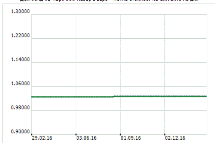
ДСК Фонд на Паричния Пазар в Евро - Нетна стойност на активите на дял