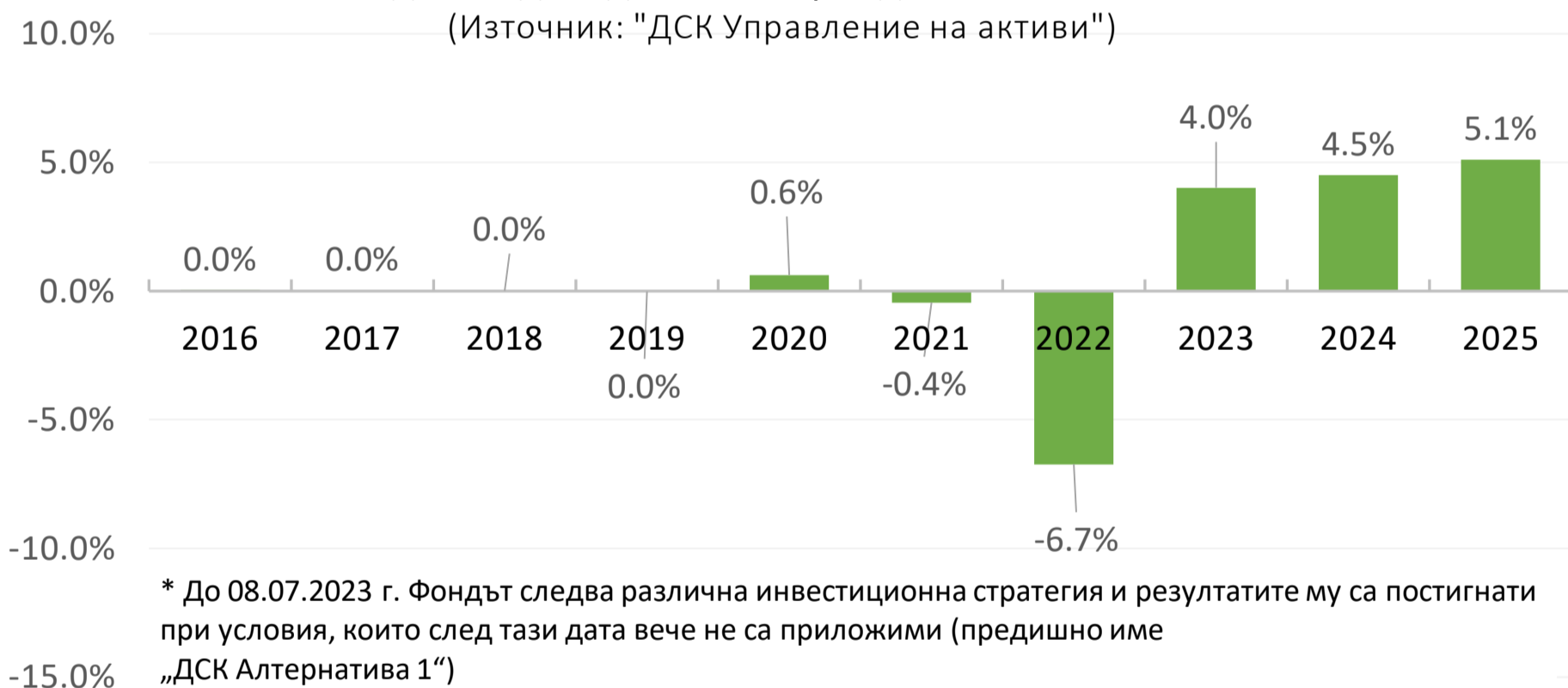
Изменение на инвестиция от 10 000 евро в 5-годишен период